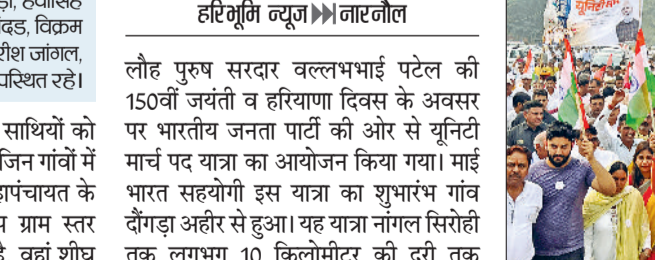
नारनौल। यूनिटी मार्च में शामिल सांसद व अन्य।