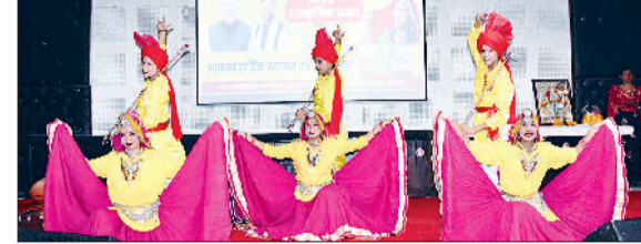
भिवानी। पंचायत भवन में जिला स्तरीय सांस्कृतिक उत्सव में हरियाणवी नृत्य की प्रस्तुति देती छात्राएं।

विधायक सराफ व विधायक वाल्मीकि ने मां सरस्वती के चित्र के समक्ष द्वीप प्रज्वलन करके किया। विधायक सराफ ने कहा कि प्रदेश सरकार नई-नई जन कल्याणकारी योजनाएं लागू कर रही है। पेपरलेस स्टॉप रजिस्ट्री ऑनलाइन शुरू की गई है, इससे रजिस्ट्री में कम खर्च होगा। इसी प्रकार से सरकार ने लाडो लक्ष्मी योजना के लिए पात्र महिलाओं के खाते में आज से 2100 रुपये डालने शुरू किए हैं, जो महिलाओं के स्वावलंबन में मिल का पथर साबित होंगे। उन्होंने कहा कि