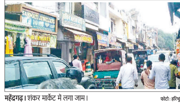
महेंद्रगढ़। शंकर मार्केट में लगा जाम।

इसके बाद भी प्रशासन द्वारा इस ओर कार्रवाई नहीं की जाती है। शहर के मुख्य बाजार और चौराहों को भी अतिक्रमण से मुक्त नहीं कराया जा रहा है। इस समय शहर का मुख्य बाजार के हालत यह है कि दिन में बाइक निकालना भी मुश्किल हो जाता है। क्योंकि दुकानें सड़क तक फैली हुई हैं, इसके बाद वहां पर अस्थायी रेहड़ी लगाने के कारण बाजारों ने गलियों का रूप ले लिया है। अतिक्रमण के कारण यहां दिन में पैदल निकलना भी मुश्किल हो जाता है। सड़क एक छोटी सी गली बनकर रह जाती है।