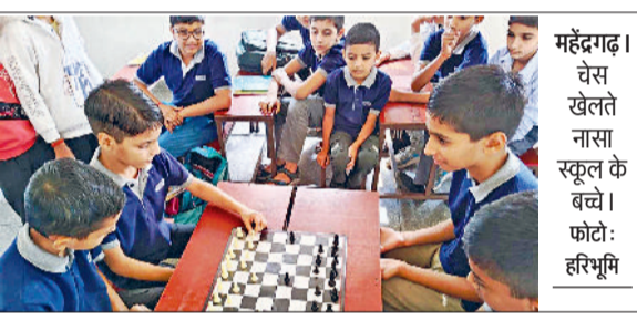
महेंद्रगढ़। वेस खेलेते नासा स्कूल के बच्चे।