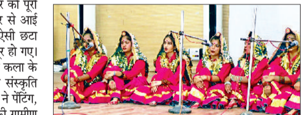
नारनौल। कार्यक्रम के दौरान अपनी प्रस्तुति देती सांस्कृतिक टीम।

नारनौल। हरियाणा दिवस पर पीजी कॉलेज शनिवार को पूरी तरह से हरियाणवी रंग में रंगा नजर आया। जिलेभर से आई सांस्कृतिक टीमों ने हरियाणवी नृत्य व गायन की ऐसी छटा बिखेरी कि सभागार में मौजूद दर्शक झूमने को मजबूर हो गए। नृत्य और गायन के अलावा कला के माध्यम से भी हरियाणा की संस्कृति को दर्शाया गया। विद्यार्थियों ने पेंटिंग, पोस्टर मेकिंग में हरियाणा की ग्रामीण जीवन शैली और ऐतिहासिक धरोहरों को केनवास पर उकेरा। वहीं स्लोगन लेखन प्रतियोगिता में प्रतिभागियों ने हरियाणवी गौरव और संस्कृति पर आधारित प्रेरणादायक नारे लिखे। इससे पहले बड़ी एलएडी के जरिए पंचकूला में आयोजित राज्य स्तरीय समारोह को लाइव दिखाया गया। जहां हरियाणा के राज्यपाल असीम घोष