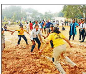
महेंद्रगढ़। खेलकूद में भाग लेते खिलाड़ी व हरियाणवी सांस्कृतिक कार्यक्रम प्रस्तुत करती छात्राएं।