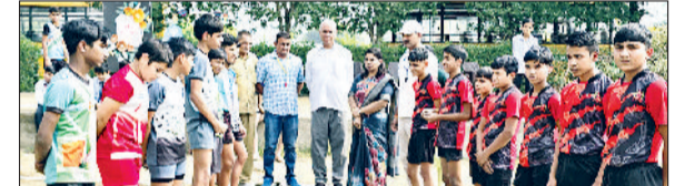
भिवानी। सांस्कृतिक प्रस्तुति देते विद्यार्थी।

श्रीलाल बहादुर शास्त्री वमा विद्यालय में हरियाणा दिवस बड़े हर्ष और उत्साह के साथ मनाया। कार्यक्रम की शुरुआत राष्ट्रगान और द्वीप प्रज्वलन के साथ हुई। विद्यालय परिसर हरियाणा की संस्कृति और परंपरा की झलकियों से सजा हुआ था। कार्यक्रम के अंतर्गत फ्रेडली कबड्डी मैच का आयोजन सिटी सीनियर सेकेंडरी