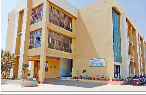
अस्पताल में 350 रोगियों की चल रही औपडी यहां अस्पताल में प्रतिदिन औसतन 350 रोगी औपडी में विभिन्न बीमारियों जैसे जोड़ों का दर्द, मधुमेह, उच्च रक्तचाप, तंत्र रोग, स्त्री रोग तथा पंचकर्म, क्षारसुत्र एवं योग वेलेनेस परामर्श लेने आते हैं। अस्पताल में अर्ती रोगियों के लिए नि:शुल्क भोजन की व्यवस्था है, वहीं दैनिक नि:शुल्क योग कक्षाएं भी कराया जाता है।

को उपचार किया गया। यह भी एक कारण रहा, जिस वजह भी कक्षाएं देरी का कारण रही। फिर प्रदेश के एकमात्र सरकारी आयुर्वेदिक कॉलेज की शुरुआत वर्ष 2022 से हुई थी। उस समय 100 सीटों पर दाखिले हुए थे। गत वर्ष कठोर मानकों के कारण एनसीआईएसएम ने कॉलेज में वर्ष 2023 में घटकर 70 और 2024 में इससे भी ज्यादा घटकर 30 सीटों पर दाखिले हुए थे। इस बार जब नया सत्र शुरू हुआ, तब सरकार ने 33 सीटें और बढ़ाते हुए इस वर्ष के लिए 63 सीटें निर्धारित की थीं। दूसरी ओर कॉलेज प्रशासन की ओर से आयुष विभाग के उच्चाधिकारियों को पत्राचार जारी रखा गया और इसमें विधायक ओमप्रकाश यादव एवं स्वास्थ्य मंत्री आरती राव की भी मदद ली गई।