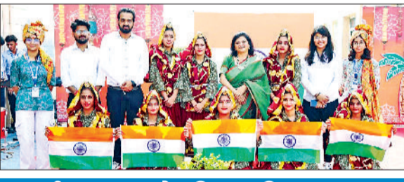
महेंद्रगढ़। सांस्कृतिक कार्यक्रम में भाग ले रहे बच्चे।