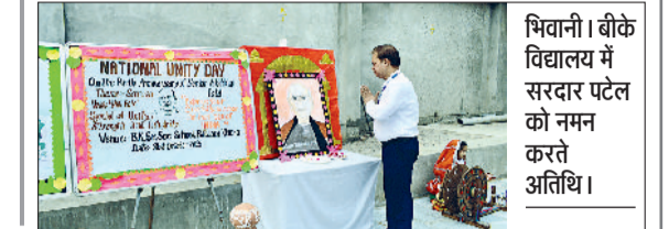
भिवानी। बीके विद्यालय में सरदार पटेल को नमन करते अतिथि।