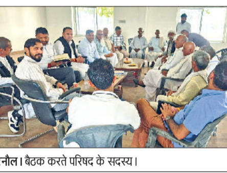
नारनौल। बैठक करते परिषद के सदस्य।