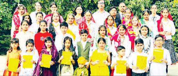
भिवानी। शिक्षकों के साथ हरियाणवी संस्कृति की प्रस्तुति देने वाली छात्राएं।

श्रीलाल बहादुर शास्त्री वमा विद्यालय में हरियाणा दिवस बड़े हर्ष और उत्साह के साथ मनाया। कार्यक्रम की शुरुआत राष्ट्रगान और द्वीप प्रज्वलन के साथ हुई। विद्यालय परिसर हरियाणा की संस्कृति और परंपरा की झलकियों से सजा हुआ था। कार्यक्रम के अंतर्गत फ्रेडली कबड्डी मैच का आयोजन सिटी सीनियर सेकेंडरी