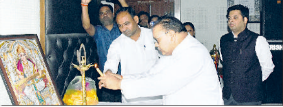
भिवानी। पंचायत भवन में जिला स्तरीय सांस्कृतिक उत्सव का द्वीप प्रज्वलित करके शुभारंभ करते विधायक घनश्यामदास सराफ व विधायक कपूर सिंह वाल्मीकि।