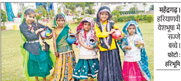
महेंद्रगढ़। हरियाणवी वेशभूषा में सज्जे बच्चे।

बता दें कि शहर की गांधी मार्केट, शांति कॉम्प्लेक्स, 11 हट्टा बाजार, आईटीआई रोड, रेलवे रोड, सिनेमा रोड, सरफा बाजार, अंबेडकर चौक की ओर जाने वाला मार्ग, मसाली चौक, मसाली चौक की ओर जाने वाला मार्ग सहित अनेक बाजारों में दुकानदारों ने अतिक्रमण किया हुआ यहाँ नहीं नगर पालिका कार्यालय के सामने बनी दुकानदारों ने भी आधी सड़क पर अपना सामान रखकर अतिक्रमण किया हुआ। ऐसे में अंदाजा लगाया जा सकता नगर पालिका कार्यालय के सामने ही अतिक्रमण है तो वह नगर पालिका के अधिकारी शहर को कैसे अतिक्रमण मुक्त करवा पाएगा।