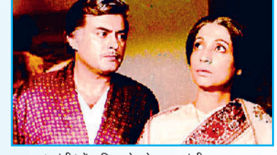
'आंधी' में सुवित्रा सेन के साथ संजीव कुमार

दूसरे को कह देते थे-संजीव कुमार बन रहे हो? संजीव कुमार के द्वारा निभाए गए यादगार किरदारों में 'मौसम' के डॉक्टर अमरनाथ को कैसे भूला जा सकता है? इस फिल्म में उनका डबल रोल, शर्मिला टैगोर के रोल से किसी तरह से कमतर नहीं रहा। इसी तरह फिल्म 'त्रिशूल' तो अमिताभ की कही जाती है, लेकिन इसमें संजीव कुमार ने एक ऐसे व्यापारी का रोल प्ले किया, जो अंजाने में ही अपने बेटे से व्यापारिक संघर्ष कर रहा होता है और उसे पता ही नहीं चलता। इसमें पिता-पुत्र के संवाद, दो प्रतिद्वंद्वी व्यापारियों को उस लड़ाई का प्रतिनिधित्व करते हैं, जिसमें वे अपनी जीत के लिए किसी भी स्तर तक जा सकते हैं। उन पर फिल्माए गाने भी हुए हिट: संजीव कुमार पर फिल्माए गाने भी सुपरहिट रहे। 'अनोखी रात' का गीत 'ओह रे ताल मिले नदी के जल में, नदी मिले सागर में', 'खिलौना' का 'खिलौना जानकर तुम तो', 'सीता और गीता' का 'हवा के साथ-साथ, 'अनामिका' का 'मेरी भीगी भीगी सी पलकों पे', 'आंधी' का 'तुम आ गए हो, नूर आ गया है', 'मौसम' का 'दिल ढूँढता है फिर वहीं फुसंत के रात-दिन' और 'सिलसिला' का 'रंग बरसे', हर दौर के हिट गानों की श्रेणी में गिने जाते हैं। अधूरी रही प्रेम की दास्तान: संजीव कुमार ने जिस तरह से फिल्मों में अपना परचम लहराया, उसी तरह से उनके प्रेम के चर्चे भी खूब सुने जाते रहे। हेमा मालिनी के साथ के किस्से तो सर्वाधिक चर्चित रहे ही हैं। सुलक्षणा पंडित के साथ भी उनकी जोड़ी चर्चित रही पर वह भी अपने मुकाम पर पहुंचने से रह गईं। खुद के बारे में भी कई अपनी ही भविष्यवाणी को सच साबित करते हुए जीवन के पचास बसंत पूर्ण करने से पहले ही 6 नवंबर 1985 को अनंत आकाश में हमेशा-हमेशा के लिए विलीन हो गए। k