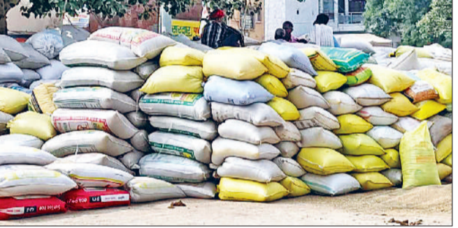
महेन्द्रगढ़। अनाज मंडी में कट्टों में भरकर रखा बाजरा।

हरिभूमि न्यूज महेंद्रगढ़ अबकी बार बाजरे की सरकारी खरीद अब तक भी चालू नहीं होने से किसान प्राइवेट में आदतियों के हाथों बाजरा बेचने को मजबूर हो रहे हैं। हालांकि किसान सरकारी खरीद चालू नहीं होने का फायदा उठाते दिख रहे हैं और बाजरे का महज 1900 रुपये प्रति विंटल की दर से ही खरीद रहे हैं, जबकि सरकार ने इस बार बाजरे का सरकारी समर्थन मूल्य 2775 रुपये प्रति विंटल घोषित किया हुआ है। ऐसे में आदतियों की खरीद एवं सरकारी रेट के बीच लगभग 975 रुपये का भारी अंतर बना हुआ है, जबकि सरकार ने भावांतर भरपाई के तहत महज 575 रुपये ही देने की घोषणा की हुई है। ऐसे में यदि भावांतर का पैसा मिल भी जाए तो भी किसानों को सीधे एक विंटल का ही 300 रुपये का नुकसान हो रहा है। यदि एक एकड़ जमीन की पैदावार 10 विंटल बाजरा पैदा होना माना जाए तो एक किसान को प्रति एकड़ 3000 रुपये का नुकसान हो रहा है। जबकि जिन किसानों ने ज्यादा जमीन पर बाजरा बोया था, उन्हें और भी ज्यादा नुकसान हो सकता है। ऐसे में माना जा रहा है कि अबकी बार बाजरा बोने वाले किसान घाटे में ही रहेंगे।