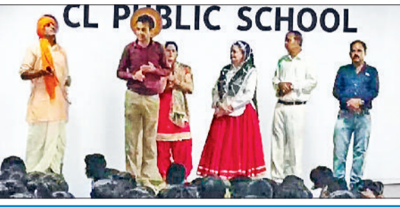
महेंद्रगढ़। वेस खेलेते नासा स्कूल के बच्चे।